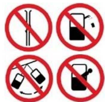
Ensemble de pictogrammes que l'on peut trouver dans une télécabine

En cas d'arrêt, attendre calmement le Redémarrage ou l'intervention du personnel.