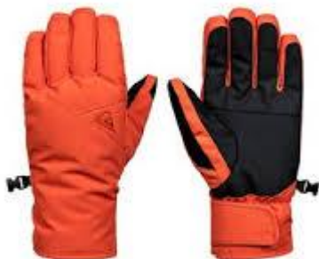
Des gants de ski