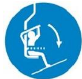
Au télésiège on baisse le garde-corps

En cas de mauvais débarquement, il vaut mieux rester assis et laisser ses jambes pousser la tige horizontale d'arrêt automatique