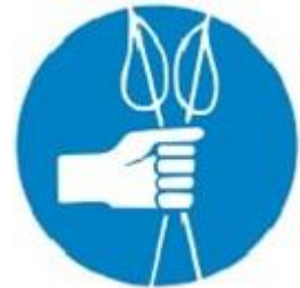
Au téléski on garde ses bâtons dans une seule main

Dégager rapidement l'aire d'arrivée au risque de se faire heurter par une perche !